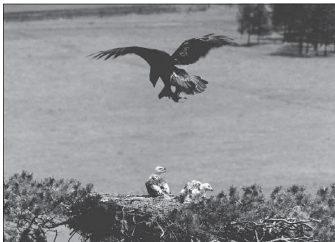
Фото 2. Орел-могильник – наиболее многочисленный из крупных хищников Приольхонья.