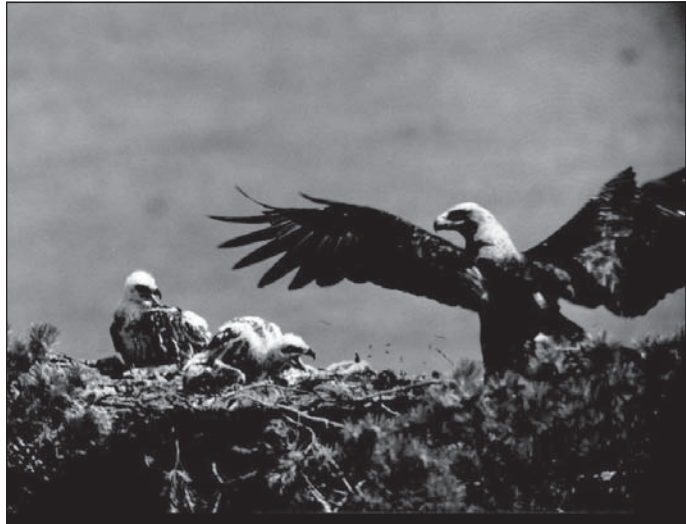
Фото 3. Орел-могильник имеет хорошо выраженный контраст между светлоокрашенной головой и темно-бурым туловищем.

селял орел-могильник (фото 2). Другие крупные хищники – беркут ( Aquila chrysaetos ) и орлан-белохвост ( Haliaeetus albicilla ) – здесь также гнездятся, но их общая численность примерно раз в 5 уступала (и уступает сейчас) численности могильника. Могильник гнездится и охотится всегда в лесостепи, и чаще всего попадает на глаза бурятам-скотоводам. Беркут гнездится и охотится в глубине лесов, орлан-белохвост – на байкальских побережьях. У беркута и орлана нет столь яркого контраста между светлоокрашенной головой и темно-бурым туловищем, как у могильника (фото 3). Поэтому именно могильника необходимо считать “Белоголовым Орлом”, героем приведенных в данной статье мифов. И.А. Манжигеев (1978) считает, что почитание Орла в качестве первого шамана было связано с олицетворением мощи и долговечности огромного количества орлов, обитающих на Байкале и Ольхоне. Мои многолетние наблюдения свидетельствуют о том, что еще 2 десятилетия назад численность орла-могильника на этом острове