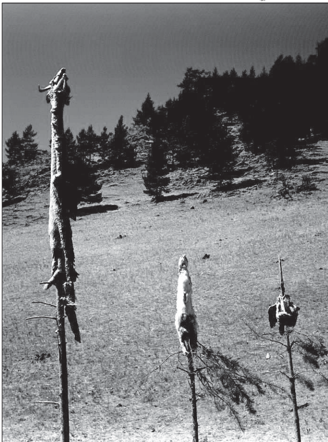
Фото 1. Жертвоприношение Хозяину Ольхона, его жене и сыну – орлу.

Вероятно именно следы подобных жертвоприношений видели состоявшие на русской службе Избрант Идес и Адам Бранд.