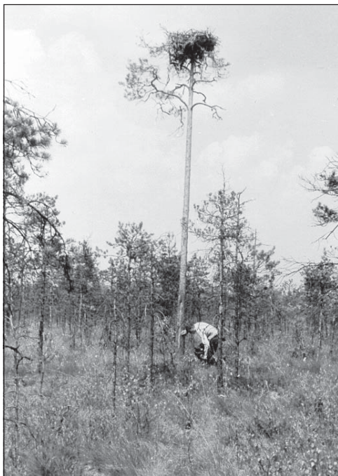
Фото 1. Типичное гнездо скопы на верховом болоте. 2.07.1988 г. Витебская обл.

Гнездовые биотопы ( n = 36 ) в 91,7 % представляли собой верховые болота, в 5,5 % – поймы озер и в 2,8 % – вырубki с отдельными деревьями. Следует специально оговорить, что, по всей видимости, роль верховых болот, как гнездовых биотопов,