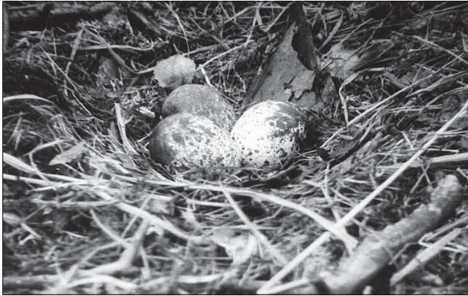
Фото 2. Кладка скопы. 7.05.1995 г. Межузол, Витебская обл. Photo 2. Clutch of the Osprey.

несколько завышена, так как им мы уделили при обследовании большее внимание, чем другим гнездопригодным территориям. Скопы гнездятся на краевых участках верховых болот, узких лесных мысах, вдающихся в болото, небольших лесных островах среди болота и отдельных более высоких соснах в сфагновых сосняках. В поймах озер найдено только два жилых гнезда: одно располагалось на небольшом островке среди низинного пойменного болота в 50 м от озера, а второе – в сосновом сухостое осоково-сфагнового пойменного болота, подпруженного бобрами, в 200 м от озера. На заболоченной вырубке с одиночными деревьями найдено только одно гнездо.