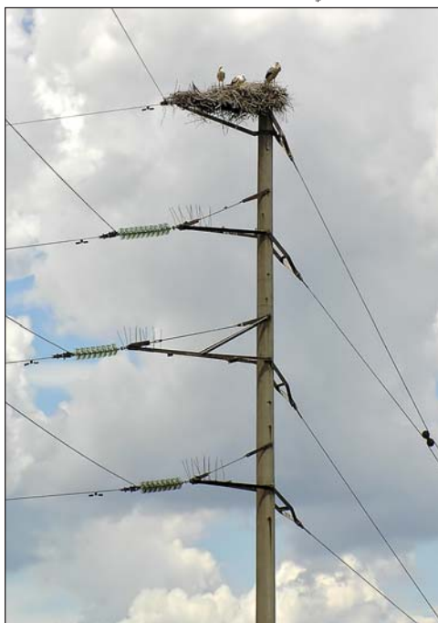
Фото 2. Аисты освоили для гнездования и опоры высоковольтных ЛЭП.

Последние десятилетия рост количества гнезд белых аистов на электролиниях происходит практически повсеместно, причем