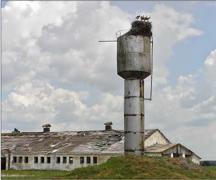
Фото 3. Типичное место гнездования белого аиста в бывшем СССР: водонапорная башня на ферме.

7.07.2005 г., с. Сувид, Киевская область.