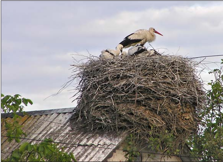
Фото 1. Гнезда на постройках встречаются все реже, но они есть. Аисты умудряются загнездиться даже на шиферных крышах.

27.06.2005 г., пгт Бородянка, Киевская область.