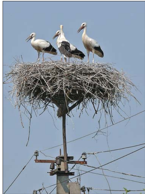
Фото 4. Платформа, поднимающая гнездо на столбе над проводами.

Когда появляется возможность гнездиться на деревьях, аисты вполне охотно это делают. Так, в 1997 г. в некоторых районах Волыни пронеслась сильная буря, оставившая после себя множество сломанных деревьев. В следующем году на многих из них появились гнезда аистов (Шкаран, 1999). Однако, таких гнезд хватает, как правило, ненадолго. В течение нескольких лет они или обрастают ветками, или деревья полностью усыхают и со временем падают. Кроме того, сломанные деревья часто попросту срезаются людьми. Гнезда на постройках, даже соломенных крышах, более долговечны. На капитальных же сооружениях места гнездования могут существовать не только десятки, но и сотни лет. Так, в Чехии 1,9 % учтенных в 1984 г. гнезд были известны еще с XIX в. Старейшее гнездо