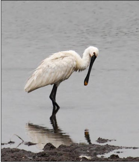
Фото 1. Косар на ставку біля с. Борщівка. Тернопільська обл. 15.07.2008 р.

Тут і далі фото В.М. Грищенка. Photo 1. A Spoonbill in Ternopil region.