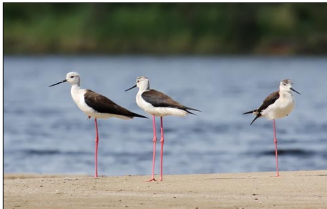
Фото 3. Відпочиваючі кулики-довгоноги. Канівський заповідник, Черкаська обл. 3.06.2008 р. Photo 3. Resting Black-winged Stilts.

5–6.05.2007 р. парні крики журавлів відмічалися на болотах вздовж р. Івотки між смт Свеса і с. Неплюєве Ямпільського району Сумської області.