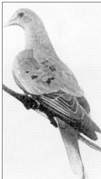
Фото 3. Марта – “последняя из могилок”.

40 миллионов (Tiainen, Pakkala, 1997). По сравнению с этим численность странствующих голубей выглядит просто неимоверной. Зоологи пытались оценить количество