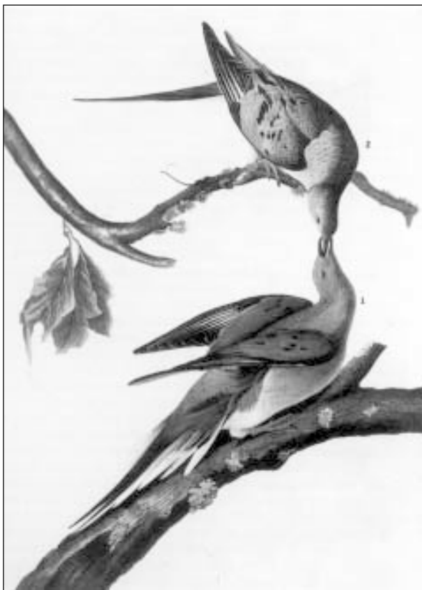
Рис. 1. Странствующие голуби, сверху самка, снизу самец. Рисунок из книги Дж. Одюбона “The Birds of America” (из: Fuller, 2001).

Эти птицы не связывали себя с определенным временем года. Период размножения был растянут с марта по сентябрь, но чаще всего яйца откладывались в апреле и мае. Гнезда устраивались на развилках высоко в кронах. Предпочитались крупные ветви у ствола. Строили гнездо обе птицы.