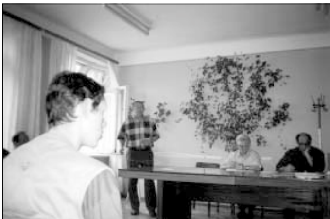
На одном из заседаний семинара.

11. Обращают внимание руководителей заповедников и национальных парков на то обстоятельство, что любые формы туризма (включая так называемый экотуризм) являются коммерческим природопользованием и недопустимы на территориях, где