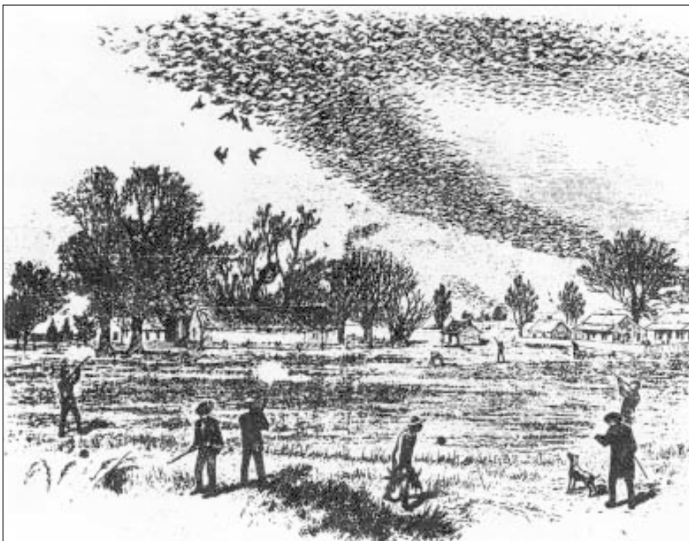
Рис. 2. Охота на странствующих голубей в Луизиане, рисунок в одной из газет в 1875 г. (из: Sedlag, 1983).

шек и специальных приспособлений вроде пулеметов. Майн Рид, например, в одной из своих книг упоминает об “охоте” на них из армейского орудия, заряженного картечью. После каждого выстрела следовал дождь птиц, сыпавшихся на землю.