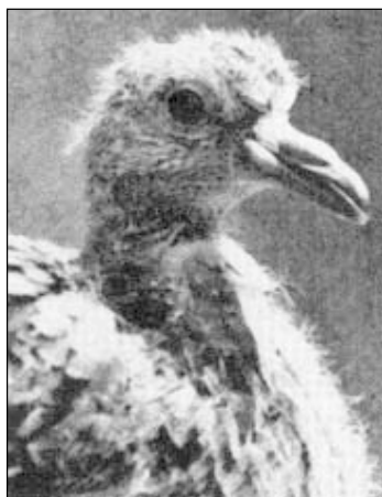
Фото 2. Птенец странствующего голубя (из: Fuller, 2001).

После окончания гнездового периода голуби собирались в стаи и разлетались