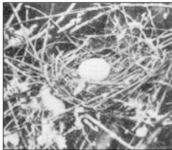
Фото 1. Гнездо странствующего голубя (из: Fuller, 2001).

несколько раз за год, другие же едят только об одном выводке за лето.