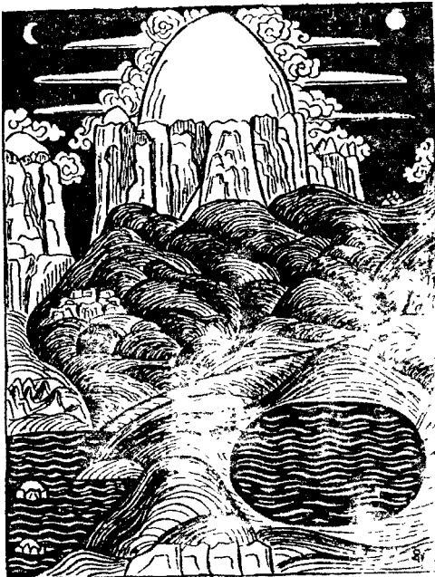
Гора Кайласа на Тибетской танке.

тилицем космической силы и называют священной горой.