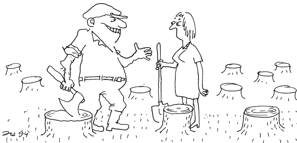
Рис. Э.Д. Шукурова

— Наконец, готова площадь для получения гранта на озеленение!